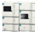
WAVE SYSTEM 4500HT Nucleic Acid Fragment Analyzer