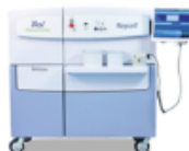
RAY CELL MK2 X-ray Blood Irradiator